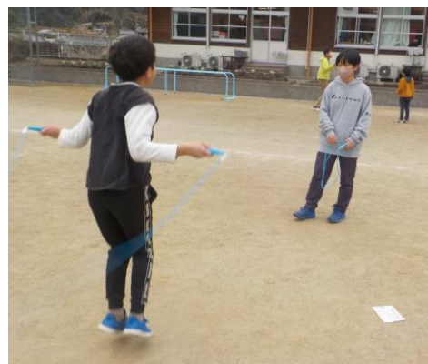
▲1月10日(水)朝運動は縄跳びに変わりました。高学年と低・中学年がペアになり、跳び方を教えたり数えあったりしています。

新年、明けましておめでとうございます。わずか14日間の冬休みが終わり、全員がそろって3学期の始業式を迎えられたことをうれしく思います。保護者の皆様、地域の皆様、本年もどうぞよろしく申し上げます。